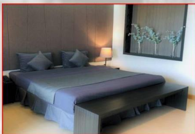
ห้อง MODERN 1