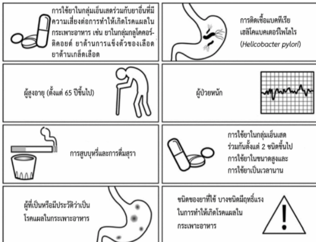
รูปที่ 2 ปัจจัยส่งเสริมการเกิดโรคแผลในกระเพาะอาหารที่เนื่องมาจากยาในกลุ่มเอ็นเสด (ดัดแปลงจาก Varrassi G, Pergolizzi JV, Dowling P, Paladini A. Adv Ther 2020; 37:61-82)

ยาแก้ปวดในกลุ่มเอ็นเสดทำให้เกิดโรคแผลในกระเพาะอาหารหรือ “โรคกระเพาะ” ได้ด้วยกลไกหลายอย่าง เช่น ทำให้เกิดการระคายเคืองเยื่อเมือก (epithelium) ในกระเพาะอาหารโดยตรง ทำอันตรายต่อชั้นเยื่อเมือก (mucosa) ผ่านการชักนำให้เกิดการสร้างอนุมูลอิสระ ทำให้หลอดเลือดขนาดเล็กที่ชั้นเยื่อเมือกเสียหาย เกิดการรั่วของเม็ดเลือดขาวและสารอื่น ส่งผลให้เกิดการขัดขวางการไหลเวียนเลือดบริเวณนั้นและเกิดแผลรูปร่างได้ แต่กลไกที่สำคัญเชื่อว่าเกี่ยวข้องกับฤทธิ์ยับยั้งเอนไซม์ชนิด ค็อกซ์-1 จึงยับยั้งการสร้างสารพรอสตาแกลนดินที่กระเพาะอาหาร ซึ่งที่กระเพาะอาหารนี้สารพรอสตาแกลนดินมีฤทธิ์ยับยั้งการหลั่งกรด ยับยั้งการหลั่งแกสตริน (gastrin) ซึ่งเป็นฮอร์โมน ที่มีฤทธิ์กระตุ้นการหลั่งกรด และยังกระตุ้นการหลั่ง ไบคาร์บอเนตและเมือก (สิ่งเหล่านี้ช่วยเคลือบกระเพาะอาหาร) ดังนั้นสารพรอสตาแกลนดินจึงมีบทบาทในการช่วยปกป้องผนังกระเพาะอาหาร นอกจากนี้ยังช่วยให้ผลิตเลือดเกาะกลุ่ม ทำให้เลือดที่ไหลออกมากลายเป็นลิ่มเลือดและหยุดไหล ด้วยเหตุนี้การใช้ยาในกลุ่มเอ็นเสดซึ่งยับยั้งการสร้างพรอสตาแกลนดินจึงขาดสิ่งที่ช่วยลดการหลั่งกรดและสิ่งที่ช่วยปกป้องผนังกระเพาะอาหารดังกล่าว จึงเป็นเหตุชักนำให้เกิดโรคแผลในกระเพาะอาหารได้