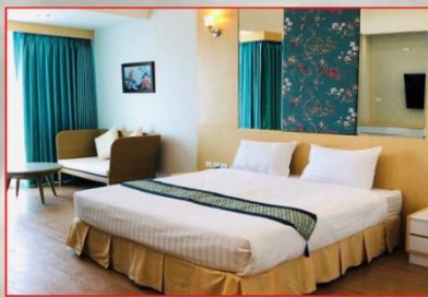
ห้องภาคใต้