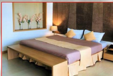
ห้อง MODERN 2