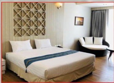
ห้องภาคอีสาน

อาคารรับรองกองทัพบก เกียกกาย ขอมอบความพิเศษสุดสำหรับคุณ ด้วยห้องพัก VIP 6 ห้อง 6 สไตล์ ให้คุณได้เลือกพักได้ตามต้องการ สะดวกสบายพร้อมที่จอดรถ 1 ช่องจอด, โทรทัศน์ระบบ SMART TV 55 นิ้ว พร้อมสิ่งอำนวยความสะดวก และเครื่องตี๋ม ชา, กาแฟ