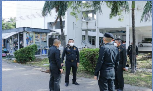
พลตรี สัมพันธ์ ดำรงค์กุล เจ้ากรมสวัสดิการทหารบก ตรวจเยี่ยมอาคารสงเคราะห์กองทัพบก (ส่วนกลาง) พื้นที่ บางเขน เพื่อดูแลสภาพความเป็นอยู่ของผู้พักอาศัย เมื่อ 21 กันยายน 2565