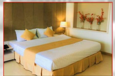
ห้อง MODERN 3