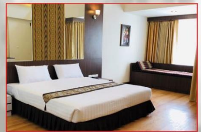
ห้องภาคเหนือ