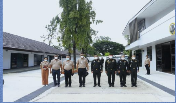
พลตรี สัมพันธ์ ดำรงค์กุล เจ้ากรมสวัสดิการทหารบก ตรวจเยี่ยมโครงการสร้างบ้านพักกำลังพลของศูนย์พัฒนากีฬากองทัพบก รามอินทรา และบ้านรับรองกองทัพบก โดยมีผู้อำนวยการศูนย์พัฒนากีฬากองทัพบก เป็นผู้นำตรวจ ณ ศูนย์พัฒนากีฬากองทัพบก รามอินทรา เมื่อ 21 กันยายน 2565