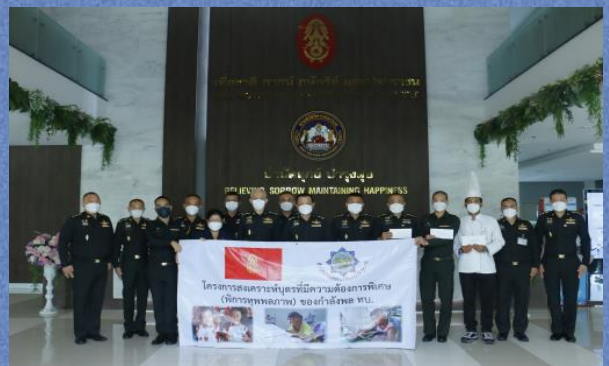
พลตรี สัมพันธ์ ดำรงค์กุล เจ้ากรมสวัสดิการทหารบก เป็นประธานพิธีมอบเงินสวัสดิการสงเคราะห์ให้กับกำลังพลที่มีบุตรที่มีความต้องการพิเศษและคู่สมรสที่พิการทุพพลภาพ ณ กรมสวัสดิการทหารบก เมื่อ 7 ตุลาคม 2565